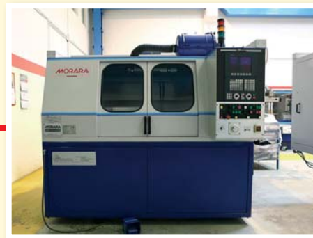
▲ Rettificatrice esterni/interni MORARA MICRO 1.2 CNC Fagor da 30.000 a 120.000 rpm mola