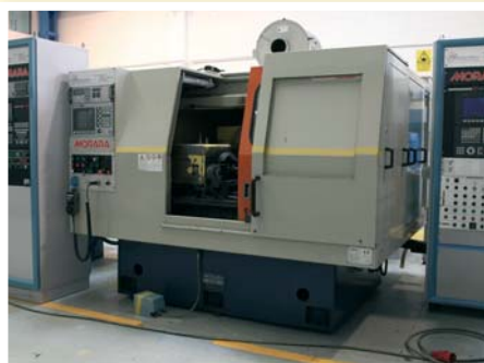
▲ Rettificatrice per esterni MORARA ES CNC mola destra \varnothing 760 \times 100 mm