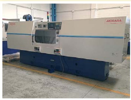
▲ Rettificatrice esterni/interni MORARA QUICK GRINDER 1500 CNC Fagor mola sinistra 508 x 189, lunghezza rettificabile 1500 x 450 mm con torretta girevole E + 1