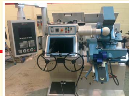
▲ Profilatrice/affilatrice PE.TE.WE. CNC con proiettore profili per lavorazioni manuali