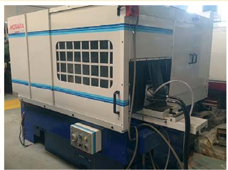
▲ Rettificatrice per esterni MORARA ED 2 700 CNC Fagor