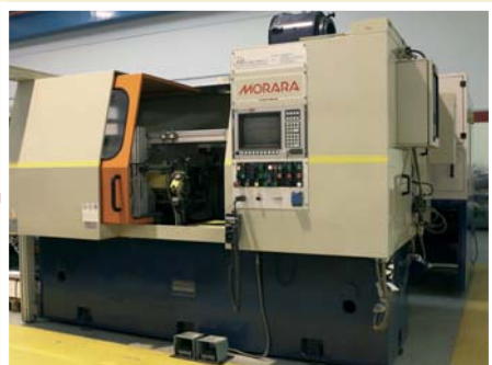
▲ Rettificatrice speciale da interni per produzione bielle MORARA MULTIMATIC CNC due teste per interni