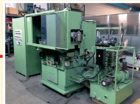
▲ Rettificatrice da interni MORARA MICRO I