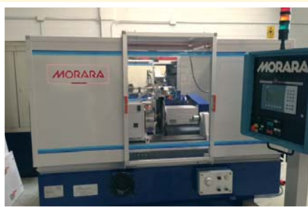
▲ Rettificatrice per esterni MORARA U400 CNC Sidac mola sinistra 500/80