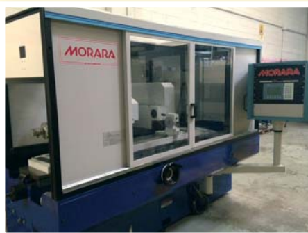
▲ Rettificatrice da interni MORARA INTERMATIC 1000 CNC Sidac , due carri e mola a tazza sfacciare