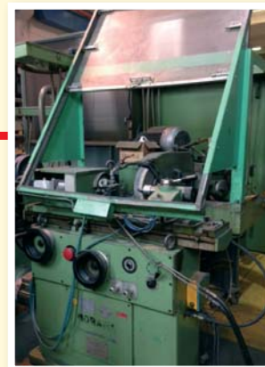
▲ Rettificatrice da esterni idraulica automatica MORARA MICRO/E-DP