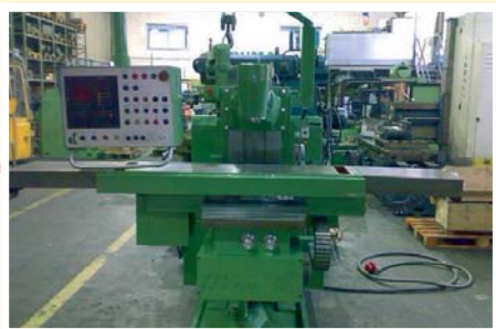
▲ Fresatrice universale DEBER FU2 1400 CN Heidenhain